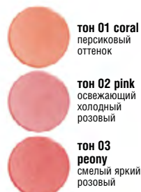
тон 01 coral персиковый оттенок

Лайфхак: румяна можно смешивать между собой для получения индивидуального оттенка