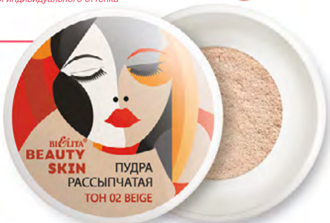
тон 02 beige