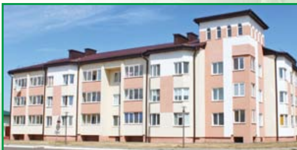
33-квартирный дом в СХК «Теплень»