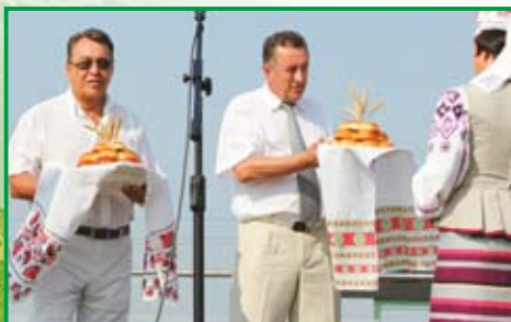
Дажинки – традиционный праздник в СХК «Теплень»