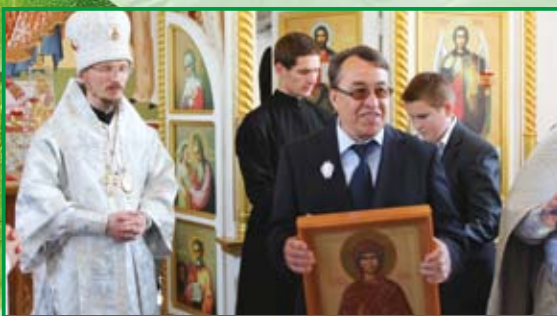
Открытие храма святой Анны в СХК «Теплень»