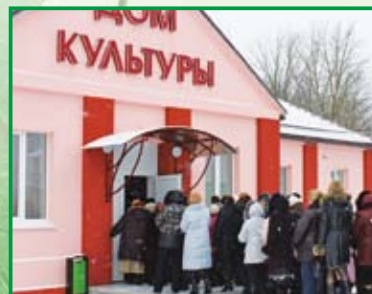
Обновленный дом культуры и стадион в СХК «Теплень» пользуются популярностью