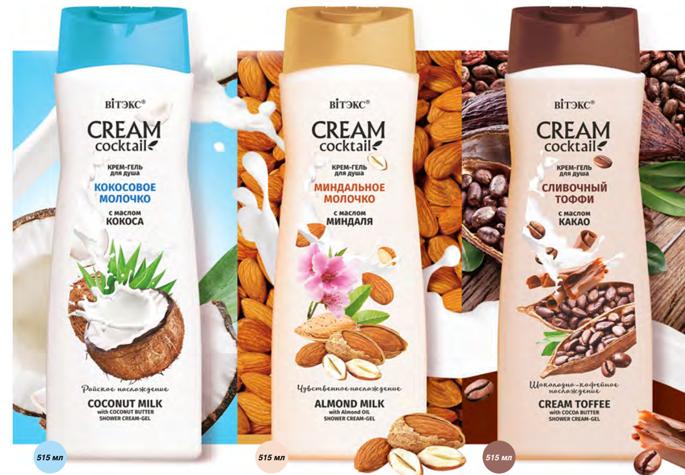
КРЕМ-ГЕЛЬ для душа КОКОСОВОЕ МОЛОЧКО с маслом КОКОСА