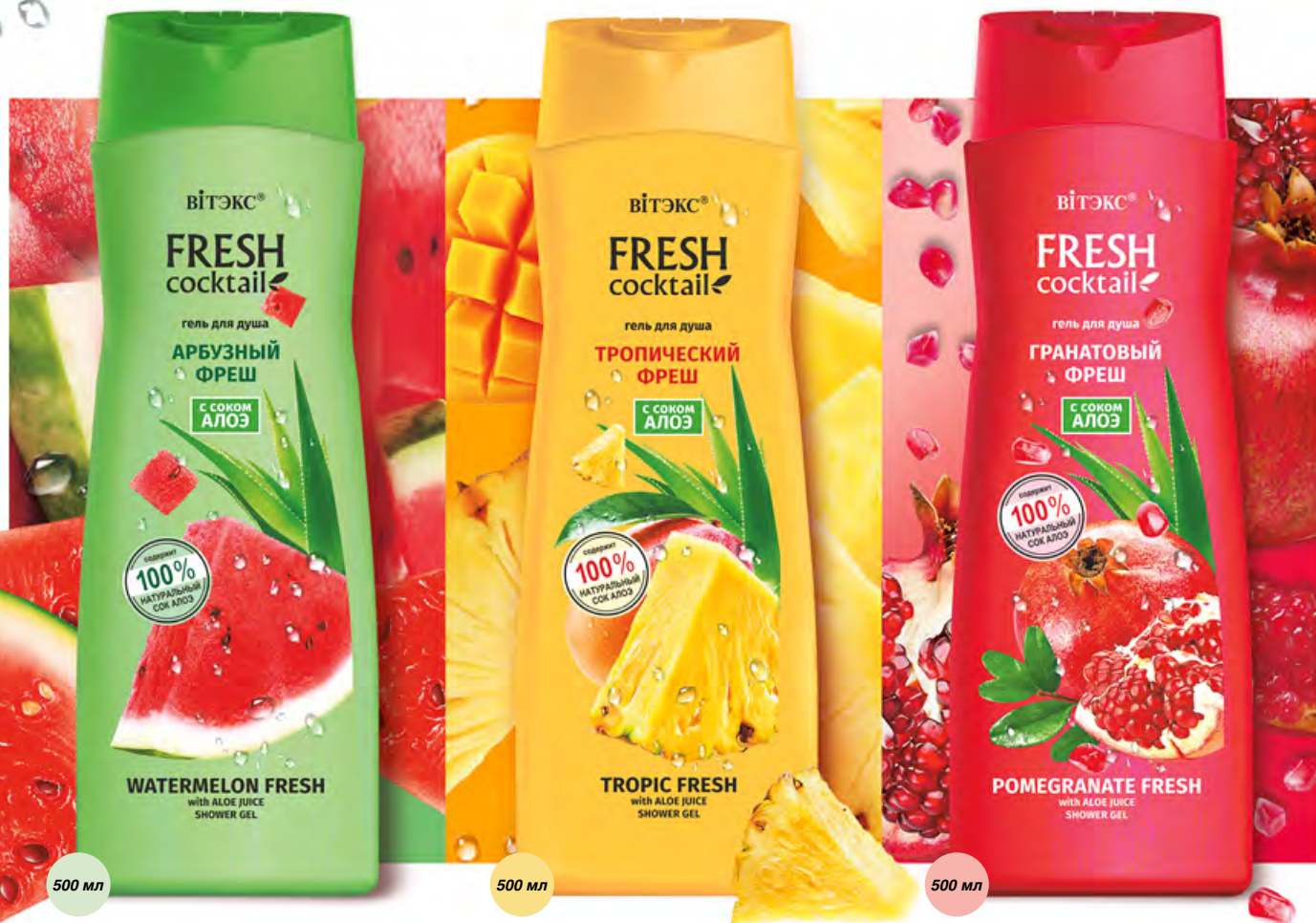
ГЕЛЬ для душа АРБУЗНЫЙ ФРЕШ с соком АЛОЭ