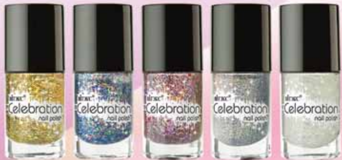
Тон 11 Золотые мечты

Лаки для ногтей Celebration — это уникальная палитра, включающая 5 ярких и непредсказуемых оттенков, каждый из которых представляет собой произведение искусства, сочетающее в себе уникальное переплетение цвета и формы.